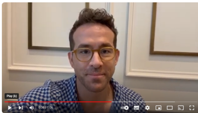
Community Foundation Wales Philanthropy Award 2024 winners - Ryan Reynolds and Rob McElhenney