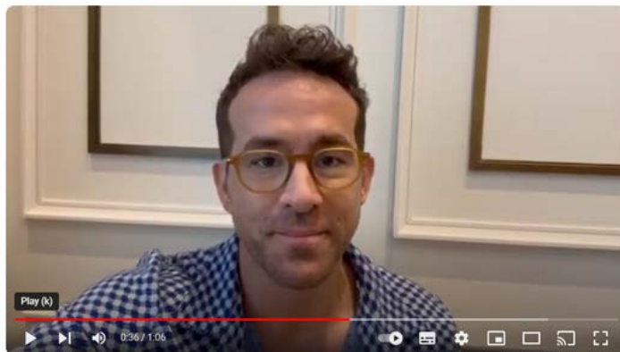
Community Foundation Wales Philanthropy Award 2024 winners - Ryan Reynolds and Rob McElhenney